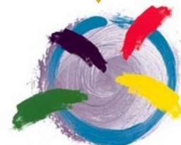
Fondazione Hirschmann Integrazione

Rotary Stiftung Zürich Hans Vontobel Fond