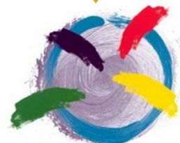
Fondazione Hirschmann Integrazione

Rotary Stiftung Zürich Hans Vontobel Fond