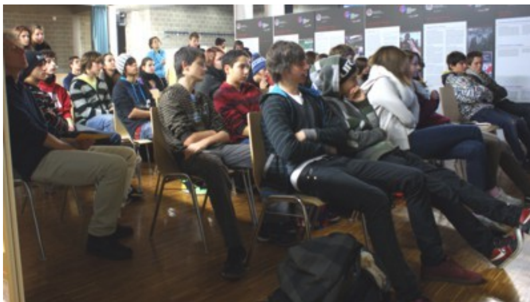
Un'immagine di una presentazione alle SM di Tesserete (2012).

Campagna di prevenzione del razzismo, della violenza e per l'integrazione attraverso lo sport