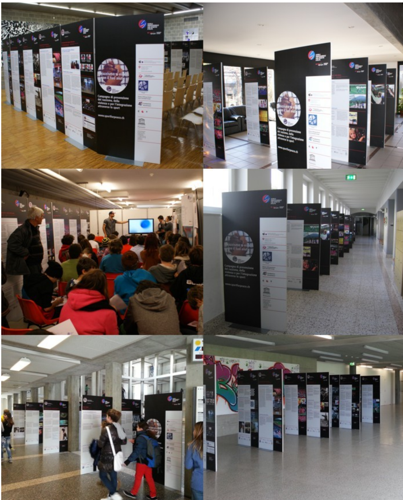
Da sinistra a destra e dall'alto al basso: SM Tesserete, Spazio Aperto, Sportech, SM Massagno, SM Riva San Vitale, SM Bellinzona 2 (2011/12 e 2012/13).

Alcune immagini (alcune possibili esposizioni).