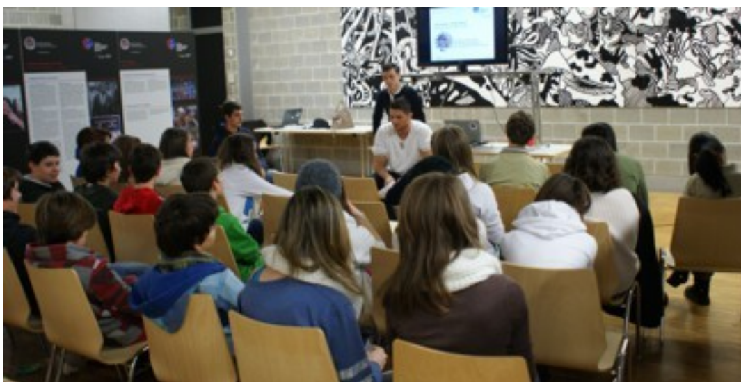
Un'immagine della discussione finale durante una presentazione alle SM di Tesserete (2012).

Campagna di prevenzione del razzismo, della violenza e per l'integrazione attraverso lo sport